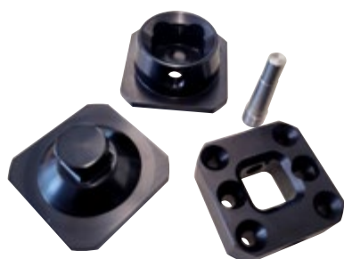
Quick Change Adapter

Mit dem Quick Change Adapter neue Dimensionen der Flexibilität und der Bequemlichkeit in der eigenen prothetischen Versorgung entdecken.