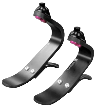
Forever II und Forever I