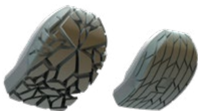
Gravel und Essential Sohle