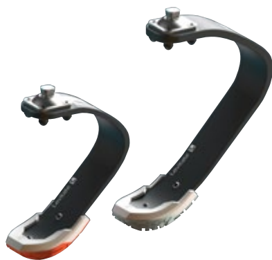
Blade 1 und Blade 2